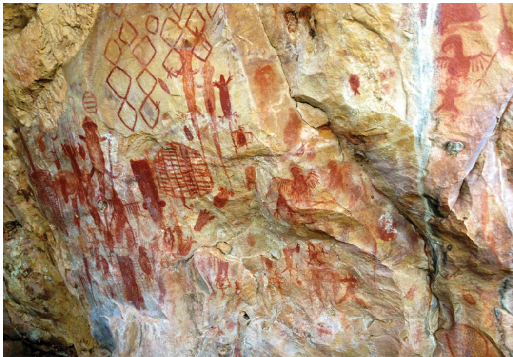
Figura 10 – Outra perspectiva do painel mais decorado de GO-Ja-03, Pousada das Araras. Notem-se as sobreposições, as representações de aves, lagartos, podomorfos, e motivos geométricos como sejam losangos.