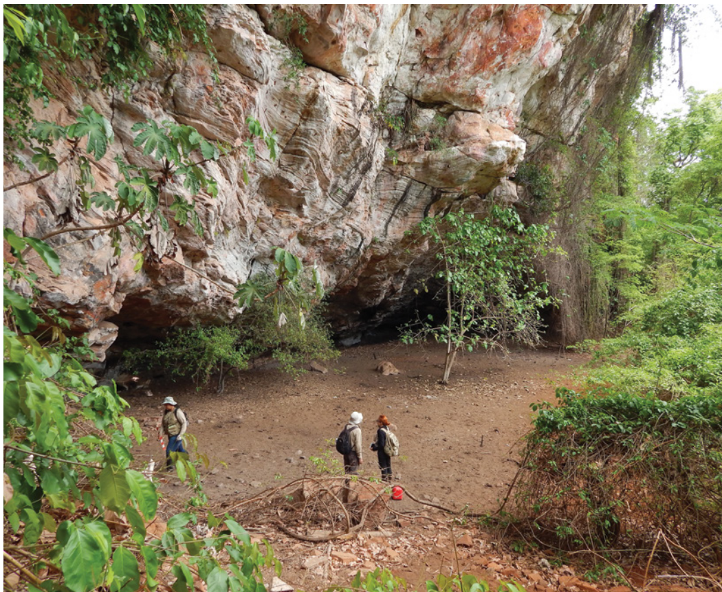
Figura 7 - Abrigo que constitui a Gruta do Diogo 1 (GO-Ja-01).

Além de um importante acervo de motivos de arte rupestre, pintados e gravados, estes abrigos preservaram quantidades consideráveis de materiais líticos e cerâmicos, associados a diferentes períodos de ocupação: as fases Paranaíba (caçadores-coletores) e Serranópolis (transição entre sociedades de caçadores e produtores de cerâmica) da Tradição Itaparica e a fase Jataí (sociedades agropecuárias e produtoras de cerâmica) da Tradição ceramista Una. A data mais antiga obtida para ocupação humana na região consiste em 10.740 \pm 85 anos AP para o sítio GO-Ja-14, com datas ulteriores representando as fases diferentes de ocupação acima notadas (Schmitz et al. 1989, 2004). (Figura 7)