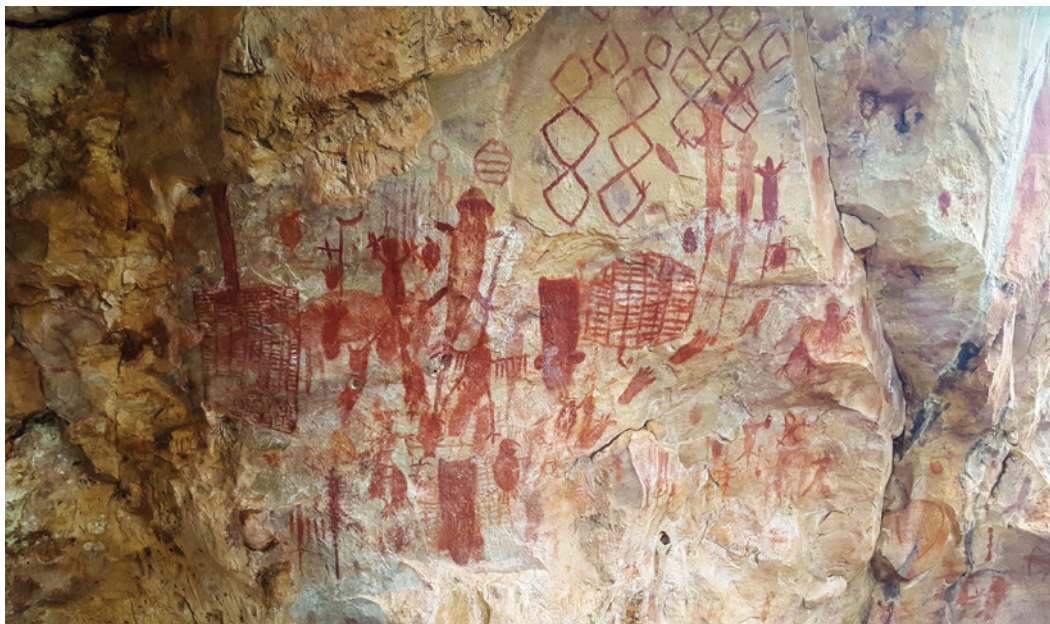
Figura 8. Painel mais profusamente decorado dos vários existentes no sítio GO-Ja-03 na Pousada das Araras, sendo observáveis muitos dos tipos de motivos naturalistas e geométricos presentes no complexo de arte rupestre de Serranópolis.