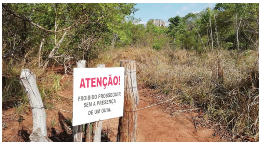
Figura 2 - Entrada para o percurso de visita à arte rupestre da Pousada das Araras.