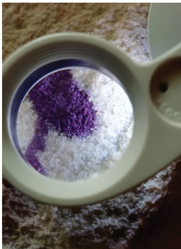
Figura 3 – Análise, com lupa portátil, de graffiti recente resultado de ato de vandalismo afetando diretamente motivo de arte rupestre. Neste caso em concreto foi utilizado um medicamento(!) veterinário de cor roxa para tratar infeções dos cascos de gado vacum.

De uma forma resumida, estes trabalhos consistiram na limpeza da vegetação e vestígios deixados pela microfauna, como sejam as galerias construídas pelas térmitas, bem como no teste de métodos para remover graffiti e outros processos que geram pátinas, como líquenes, fungos e percolação de ácidos húmicos que afetam as figuras. Outras tarefas incluíram a verificação da localização dos sítios fornecida pela equipe de Schmitz na década de 1970, a avaliação geoestrutural e ambiental, a identificação e cartografia de grutas no interior de abrigos, e documentação vídeo e fotográfica. Atenção especial foi também dada ao envolvimento da sociedade local, nomeadamente da comunidade escolar. (Figura 4)