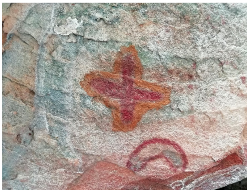
Figura 15 - Motivo geométrico representando uma cruz. Note-se o contorno a cor de laranja, tornando este um motivo bicolor. Pousada das Araras.