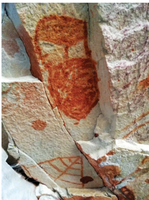
Figura 13 - Possível representação de máscara. Gruta do Mel, Complexo B.