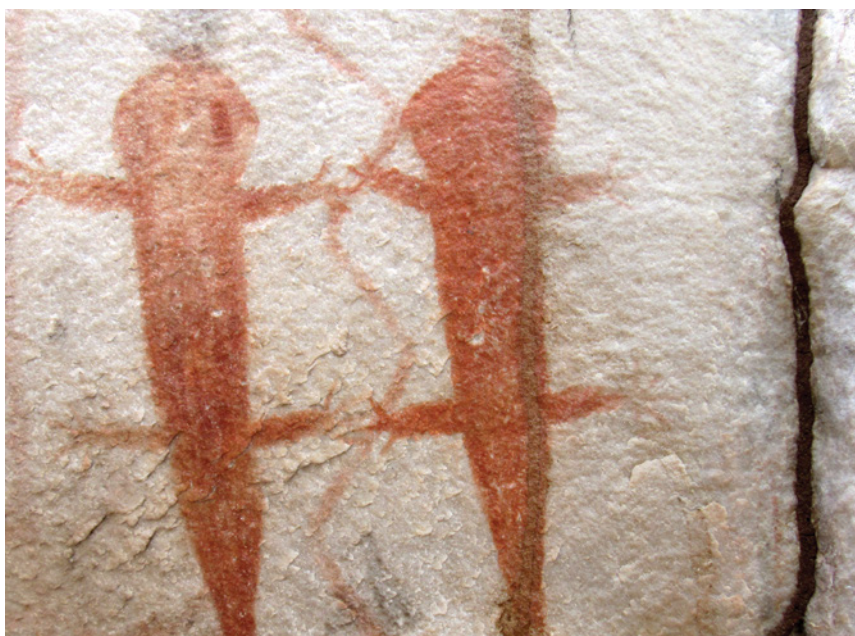
Figura 9 – Representações de lagartos em GO-Ja-03, Pousada das Araras. Note-se os motivos geométricos ao centro e esquerda da Figura, bem mais esbatidos do que as representações zoomórficas.