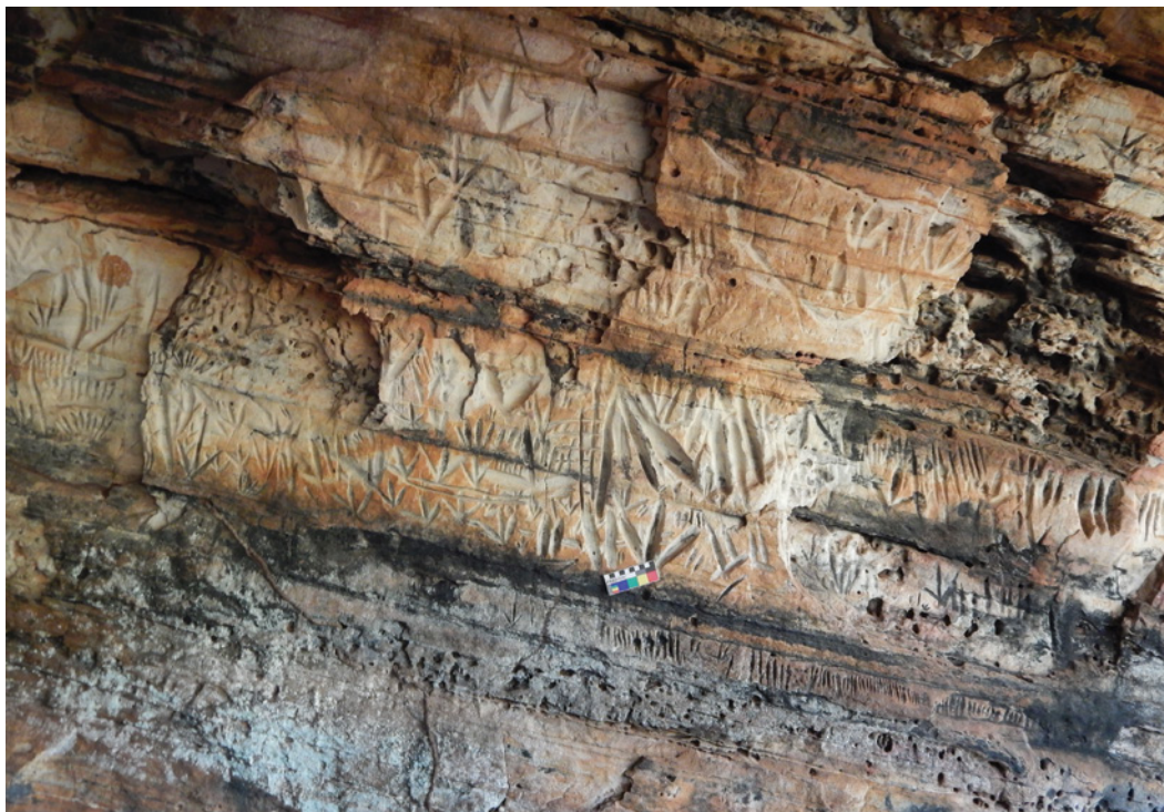
Figura 12 - Profusão de representações gravadas de pegadas de aves, e de outros motivos lineares. GO-Ja-01, Complexo do Diogo.