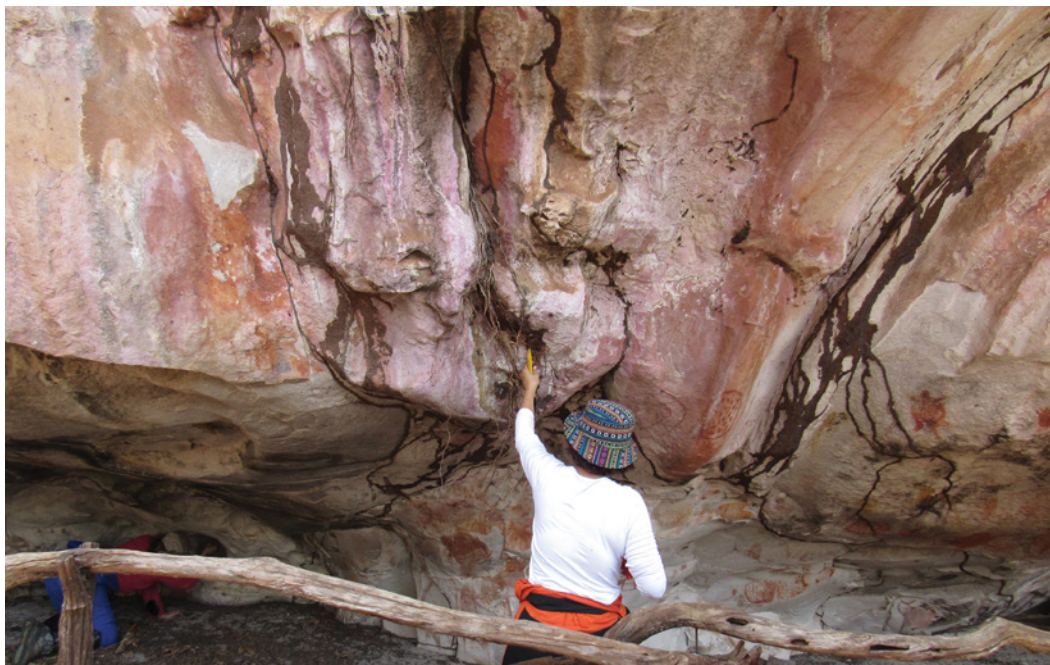
Figura 4 - Um dos membros da equipe e coautores deste escrito examinando aspectos do coberto vegetal de um painel de arte rupestre. Note-se igualmente, à direita na Figura, as galerias das térmitas afetando motivos pintados.