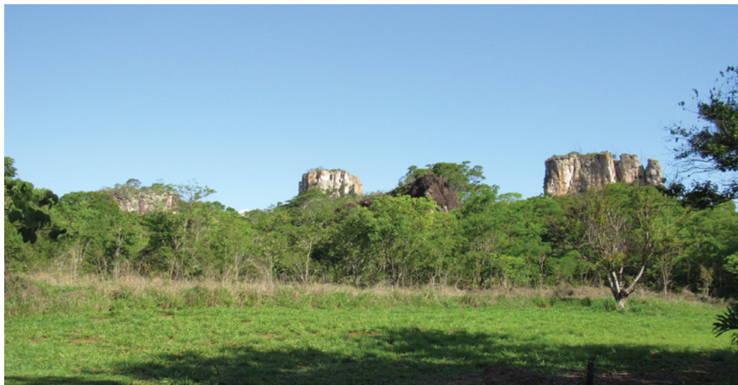
Figura 5 – Perspetiva desde a Pousada das Araras dos morros testemunho contendo painéis de arte rupestre, nomeadamente, à direita na Figura, GO-Ja-03. De realçar igualmente a presença do Bioma Cerrado, neste caso na sua fitofisionomia mais densa Cerradão, que se inicia precisamente após o final da área desmatada em torno da Pousada das Araras.