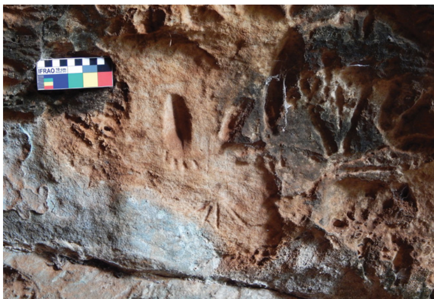
Figura 11 – Pegada humana gravada juntamente com pegada de ave. GO-Ja-01, Complexo do Diogo.