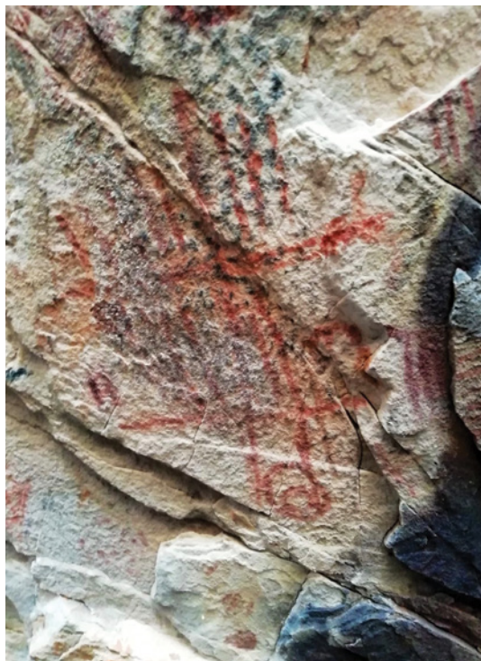
Figura 14 - Motivo (ou conjunto de motivos) de carácter geométrico de difícil categorização. GO-Ja-01, Complexo do Diogo.