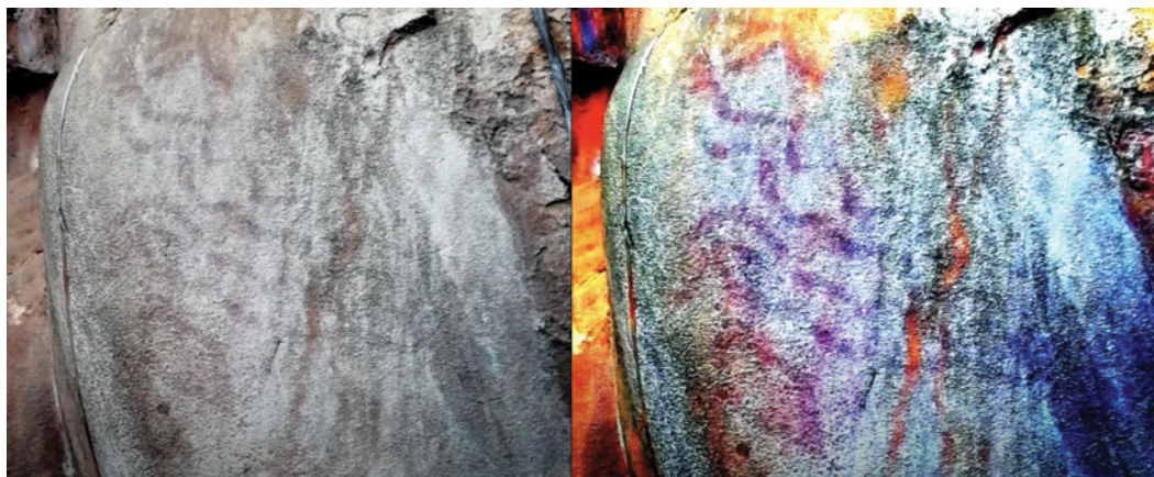
Figura 17 - O uso do aplicativo DStretch para realçar motivos pintados (imagem à direita) do Complexo do Diogo é exemplificativa de avenidas futuras de investigação relativas à arte rupestre de Serranópolis. GO-Ja-01.

Foram identificadas as prioridades para um programa de investigação abrangente que prossiga o trabalho já realizado no complexo arqueológico de Serranópolis. Um dos caminhos a seguir passará pela verificação da possibilidade de datação direta dos motivos pintados. Também a prospeção exaustiva da região e a realização de novas escavações deverão ser ações a promover, a par da revisão sistemática dos dados recolhidos pela equipa coordenada por Schmitz, incluindo nova documentação e remapeamento de motivos e abrigos. Estas ações permitirão o estabelecimento de uma cronologia mais fina da presença humana na região, caracterizando mudança e permanência no uso cultural, social e económico do território ao longo do tempo. Por diversos motivos, deste vasto programa apenas foi possível continuar com a escavação de novas áreas em abrigos já conhecidos, cujos resultados aguardam atualmente publicação. (Figura 17)