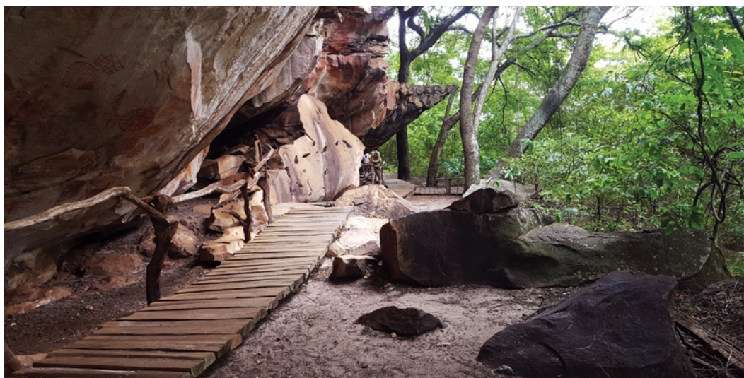
Figura 6 – Paredão onde se situam os painéis com arte rupestre do sítio GO-Ja-03.

leis federais (Ratter, Ribeiro & Bridgewater; Klink & Machado 2005; Ribeiro & Walter 2008). O município de Serranópolis acumula a sobrevivência de áreas de Cerrado razoavelmente bem preservadas, nomeadamente na Pousada das Araras, com a presença dos sítios de arte rupestre que aqui sinteticamente apresentamos. (Figura 6)